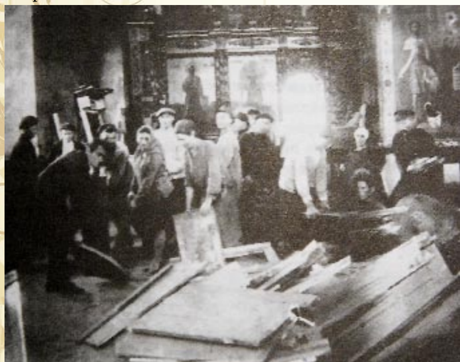
Разбор иконостаса в верхнем храме, 1931 год.

События 1917 года стали печальной страницей в истории собора. Собор подвергся несанкционированному обыскам, в результате которых большевики вынесли из храма церковные ценности, наличные деньги и процентные бумаги на сто тысяч рублей. 18 января 1918 года собор был закрыт для богослужений, однако потом был вновь возвращён верующим в 1922 году. В ходе кампании по изъятию церковных ценностей почти все реликвии были изъяты и отправлены на переплавку. Почти вся соборная ризница была уничтожена. В 1929 году даже стоял вопрос об уничтожении Успенского и Троицкого соборов астраханского кремля. Решение было пересмотрено в том же году с указом о предоставлении планов переустройства. Иконостас верхнего храм был сломан и сожжён в 1931 году в результате проведённого субботника. Красноармейцы местного гарнизона тренировались на меткость стрельбы, расстреливая святыне образа. С этого момента вплоть до 1992 года собор использовался как склад боеприпасов, казармы для военнослужащих, музей и центр массовой и пропагандистской работы по краеведению.