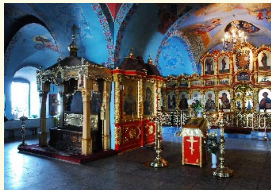
Нижний храм, современный вид.