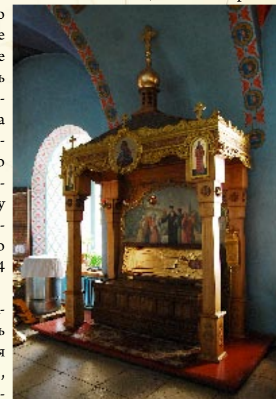
Рака с мощами святого Герасима Астраханского

Кроме того, в нижнем храме находилось захоронение святого Герасима (Добросердова), известного своими миссионерскими подвигами