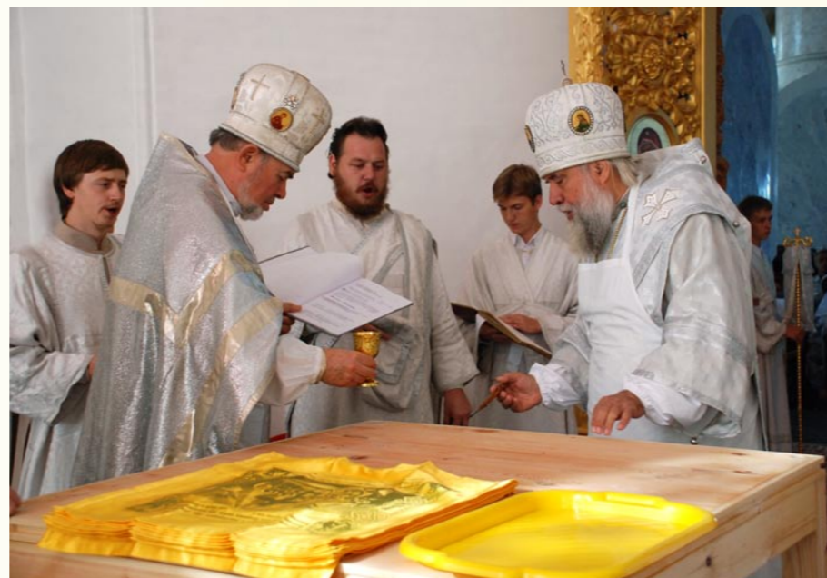
Освящение верхнего храма Успенского собора, 25 августа 2009 года.

После возвращения собора постепенно благоукрашается его внутренний и внешний вид. Стены и купола храма подновлены, восстановлена живопись в закомарах. В нижнем храме установлен новый иконостас, а потолок украшен живописью в византийской манере. В стены храма вмонтированы иконы мастеров Троице-Сергиевой лавры, исполненные в строгом каноническом древнерусском стиле. Богослужения здесь совершаются ежедневно.