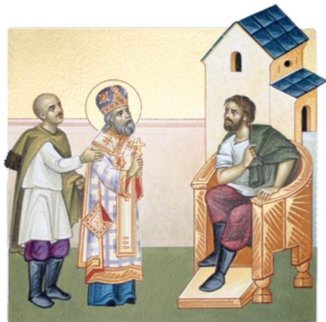
допросъ свѣтлаго іосифа