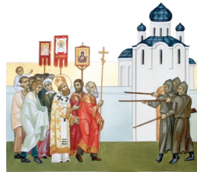
разстрѣлъ крѣтчнаго Хѣла въ Астрахани

В настоящее время мощи священномученика Иосифа покоятся в нижнем храме Успенского кафедрального собора. Перед гробом святого еженедельно совершается богослужение акафиста.