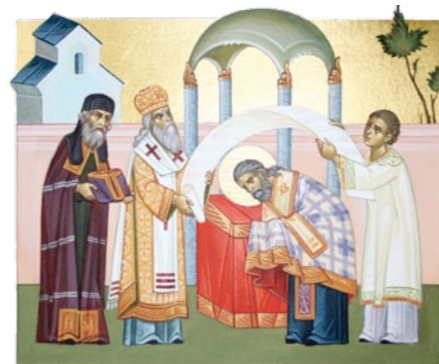
поставление сѣлаго іосифа въ митрополита патріархамъ ѿ востока

В 1654 году от моровой чумы скончался архиепископ Пахомий. Он до последних дней не покидал своей паствы - служил в храме и принимал народ. Архимандрита Иосифа моровое поветрие застигло в первопрестольной, куда он прибыл с грузом помощи от Троицкого монастыря для армии Государя Алексея Михайловича. В поисках кандидата на опустевшую астраханскую кафедру патриарх Никон обратил внимание на Троицкого архимандрита Иосифа. От лица жителей Астрахани, как духовного, так и мирского звания, была составлена грамота, в которой изъявлялось общее желание иметь отца Иосифа своим архипастырем. 4 мая 1656 года состоялась хиротония архимандрита Иосифа в архиепископа Астраханского. В Успенском соборе московского кремля рукоположение совершал сам Патриарх Никон в сослужении большого числа духовенства, в том числе Антиохийского Патриарха Макария. Месяцем позже архиепископ Иосиф отбыл на вверенную ему кафедру.