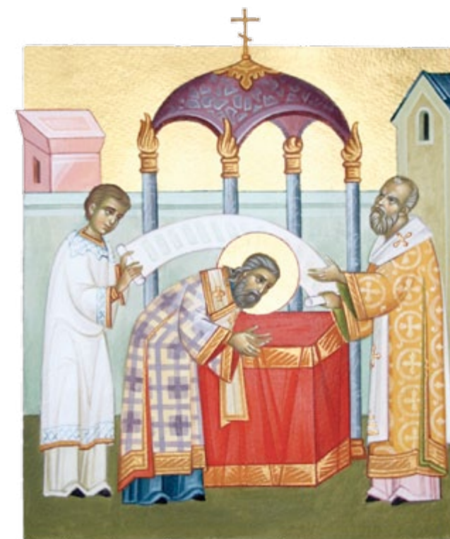
поставление сѣлаго іосифа въ епископы

Церковные реформы Патриарха Никона вызвали разногласия среди чад Русской Церкви. Весной 1663 года владыка Иосиф в числе прочих русских иерархов отбыл в Москву для соборного рассуждения. Для решения спорных вопросов в Москве вновь был созван собор в 1666 году, на который были приглашены иерархи Церкви Востока - Патриархи Паисий Александрийский и Макарий Антиохийский. Архиепископ Иосиф встречал высоких гостей в Астрахани и по приказу царя лично провожал их в Москву. Уладив на Московском Соборе все вопросы, Святейшие патриархи просили царя почтить астраханского владыку саном митрополита. С благословения Собора, Иосиф 8 июня 1667 года был поставлен Восточными иерархами митрополитом, став первым астраханским архиереем, возведенным в столь высокий сан. Митрополиту Иосифу было отведено третье место среди русских иерархов.